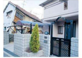
写真右:レスコハウス

現場打ちコンクリートより「軽い」「堅い」「強い」PCパネルは剛性が高く、地震による変形を抑えます。阪神・淡路大震災では、窓ガラス1枚の破損もありませんでした。