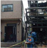
隣家火災 写真左:レスコハウス

PCパネルは燃えない建材。外部からの火災はもちろん、内側からの火にも強く、火災時のリスクを軽減できる数少ない建材です。