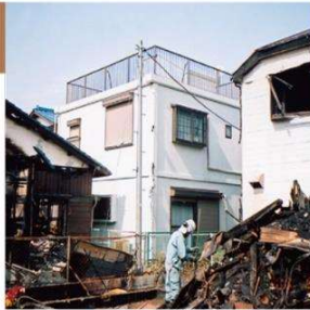
写真中央:レスコハウス