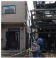
隣家火災 写真左:レスコハウス

PCパネルは燃えない建材。外部からの火災はもちろん、内側からの火にも強く、火災時のリスクを軽減できる数少ない建材です。