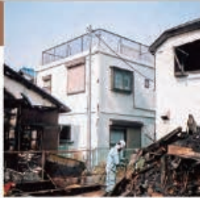
写真中央:レスコハウス