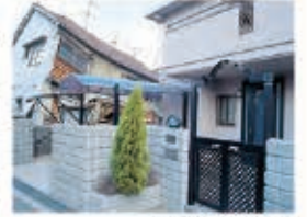
写真右:レスコハウス

現場打ちコンクリートより「軽い」「堅い」「強い」PCパネルは剛性が高く、地震による変形を抑えます。阪神・淡路大震災では、窓ガラス1枚の破損もありませんでした。